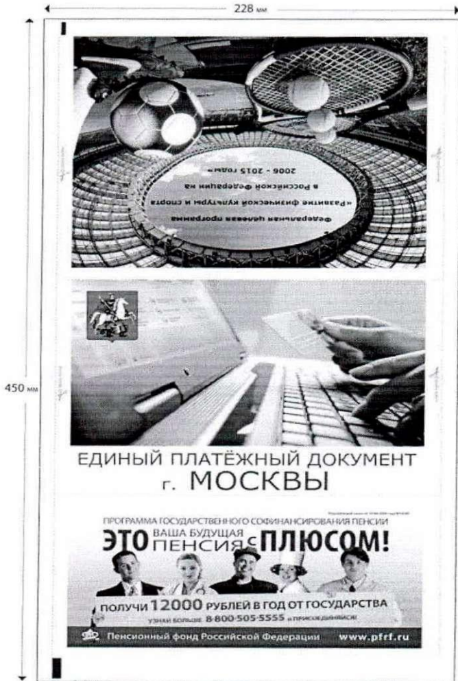
Образец внутренней стороны